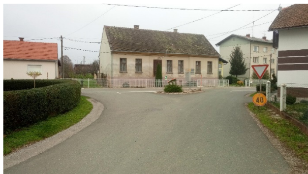
Križišče iz smeri hišne št. 1