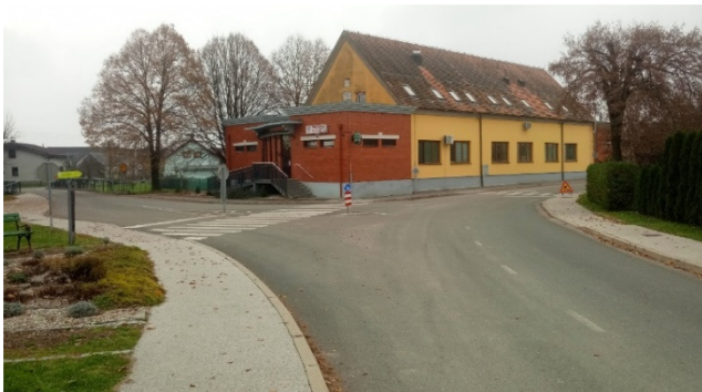
Prehod za pešce in pločnika v središču vasi v smeri proti šoli