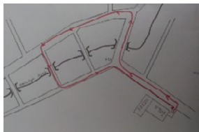
Trasa kolesarskega tekmovanja

Na šoli izvajamo prometni krožek v okviru katerega sodelujemo tudi na tekmovanju Kaj veš o prometu. Vsakih nekaj let je naša šola tudi organizator tekmovanja.