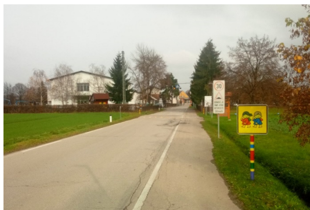
Vstop v vas iz smeri Dobrovnik