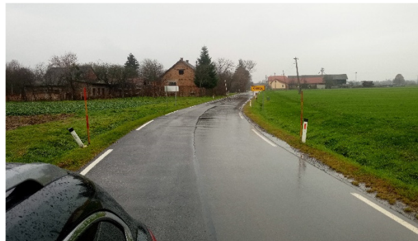
Vstop v vas iz smeri Motvarjevec