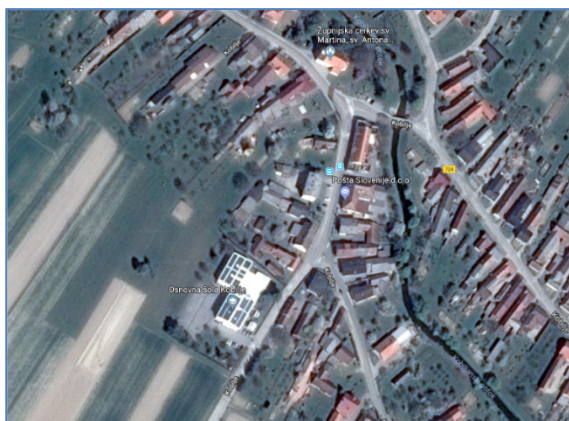
Pozicija stavbe vrtca in OŠ Kobilje

Šola se nahaja na vpadnici v vas in sicer iz smeri vasi Dobrovnik. Na šolo opozarja vertikalna (prometni znaki) in horizontalna (talni napisi in hitrostna ovira) prometna signalizacija. Prehod za peščce ob šoli je tudi osvetljen.