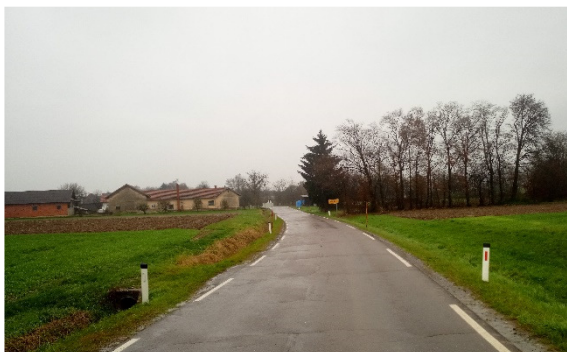
Vstop v vas iz smeri Malega Kobilje