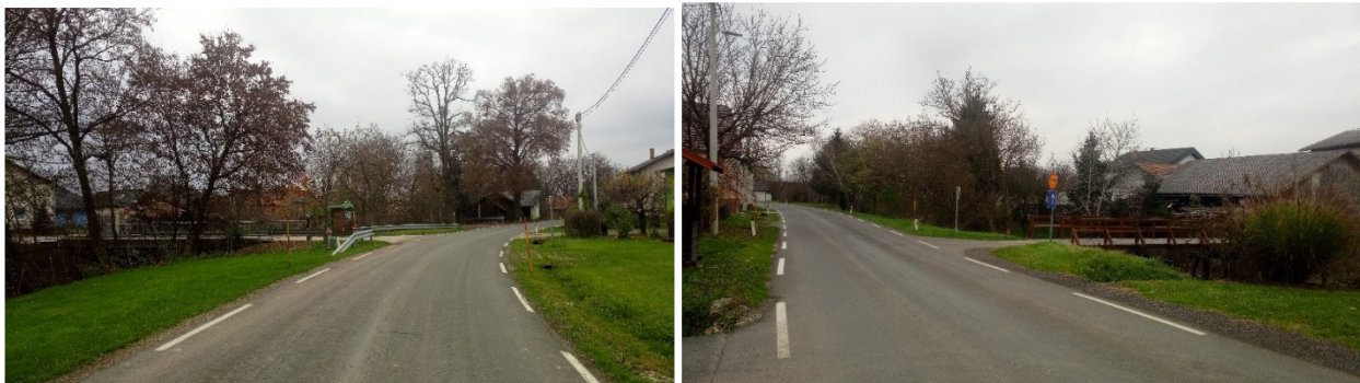
Križišči preko mostu na državno cesto

Na Kobilju se zaradi svoje lege, neposredno ob Madžarski meji, odvija tudi mednarodni promet, za kar je še dodatno ogrožena varnost udeležencev v prometu (predvsem otrok - pešcev in kolesarjev).