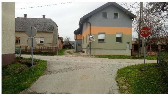
Križišči preko mostu na občinsko cesto