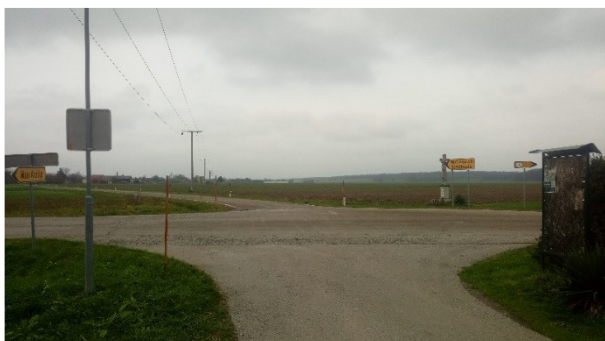
Križišče Malo Kobilje